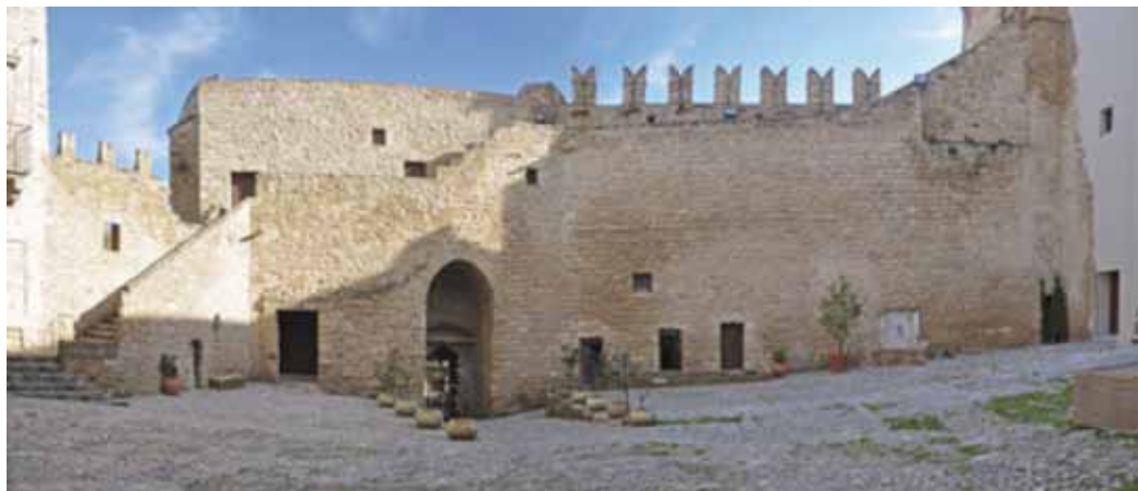
Il Castello di Carini, gentilmente messo a disposizione dall'amministrazione comunale