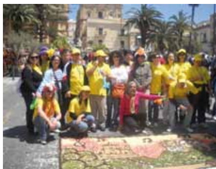
La realizzazione floreale

L'iniziativa nasce dall'esperienza di alcune cooperative socie del Consorzio Mediterraneo Solidale, impegnate nei servizi socio-assistenziali ed educativi in favore di disabili e nella gestione di Centri di aggregazione nel territorio della Provincia di Siracusa ed in particolare, la cooperativa Sociale Iris, con l'obiettivo di mettere in evidenza le buone prassi, in un simbolico gemellaggio tra cooperative siciliane e la cooperativa SocioCulturale di Venezia. L'iniziativa si è collocata all'interno di